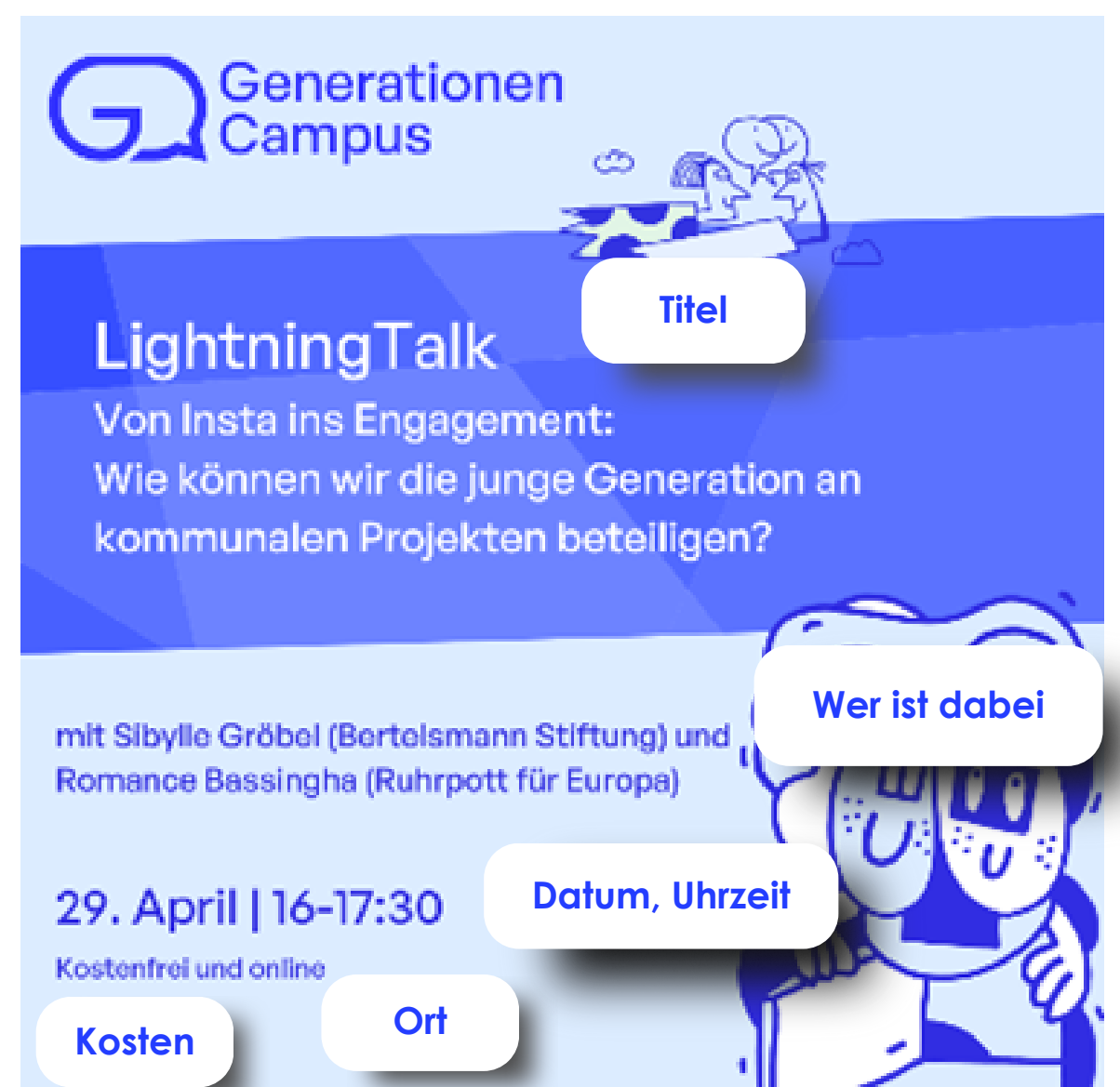
Social-Media-Post des GenerationsCampus zu einer Veranstaltung

Mit einer klaren Strategie, kreativem Content und passenden Tools lässt sich Social Media gezielt nutzen, um junge Menschen zu informieren, zu aktivieren und in Projekte einzubinden.